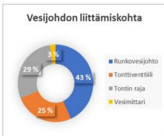
Kuva 1. Kyselyyn vastanneiden laitosten vastuuraja eli liittämiskohta vesijohtoon.

Angående ägarförhållanden är det ibland oklart var gränsen går mellan vattenverkets ledning och fastighetsägarens tomtledning. Enligt Vattenverksföreningens undersökning fördelar sig gränsdragningen på följande sätt: